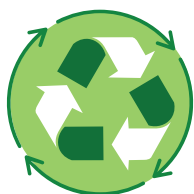
Materiale e imballaggio riciclabile

Firmato a nome e per conto del produttore/distributore: